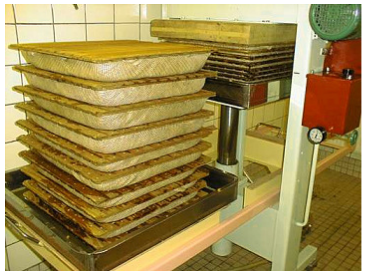
Foto 3: Geschichteter Maischestapel mit 9 Lagen. Die unteren Lagen werden durch die Auflast bereits zusammen gedrückt.