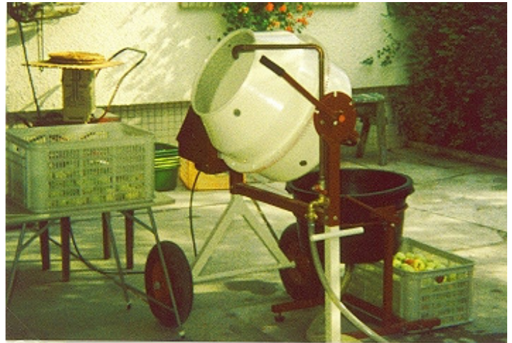
Foto 5: Betonmischer als Obstwaschmaschine mit Bütt als schwenkbares Stufenbecken mit unterem Wasserablauf. Leistung: 200 Kg/Stunde, hoher Wasserverbrauch.

Auf all die vorgenannten Fragen sollten Sie auch als Einsteiger Antworten finden. Erst wenn Sie sich zum Gesamtumfang Klarheit verschafft haben, nehmen Sie die Geräteauswahl vor. Sie vermeiden damit Fehlinvestitionen und halten sich den Weg für Weiterentwicklungen frei.