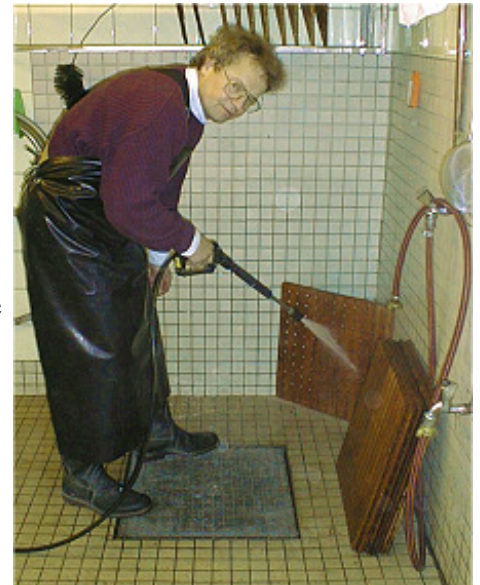
Foto 4: Reinigung der Pressrosten Wer sich für eine Packpresse entscheidet, wird um die Anschaffung eines Hochdruckreinigers nicht umhin kommen.

Nachfolgend frage ich die Kriterien ab, nach denen die Grundausstattung von Presse und Mühle erfolgen