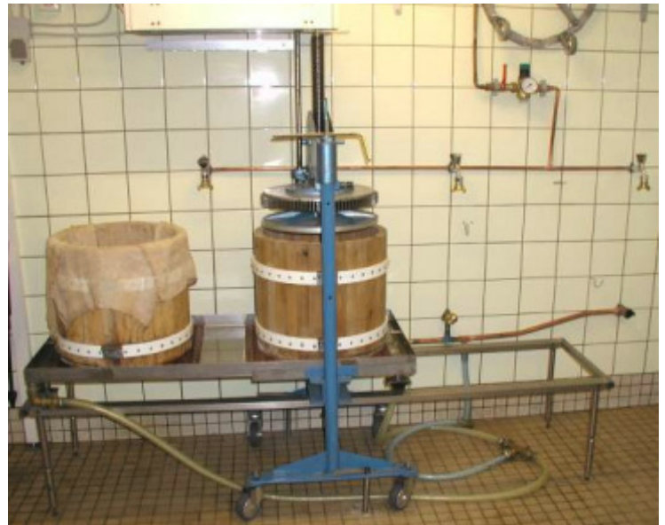
Foto 2: Spindelkorbpresse mit Motorantrieb und 2 x 50 Liter Presskörben in Schiebbetrieb. Der Pressraum wurde 1993 eigens für den Betrieb dieser Presse gebaut und ausgelegt. Davor wurde die Presse unter dem Hofdach im Freien betrieben.

Einige Hersteller behaupten Leistungsangaben über die eigenen Pressen, die für den Kunden überhaupt